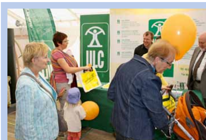
Die ULC hat mit einem Informationsstand an der Expo 2010 in Eschweiler teilgenommen die vom 18. bis 20. Juni 2010 abgehalten wurde.