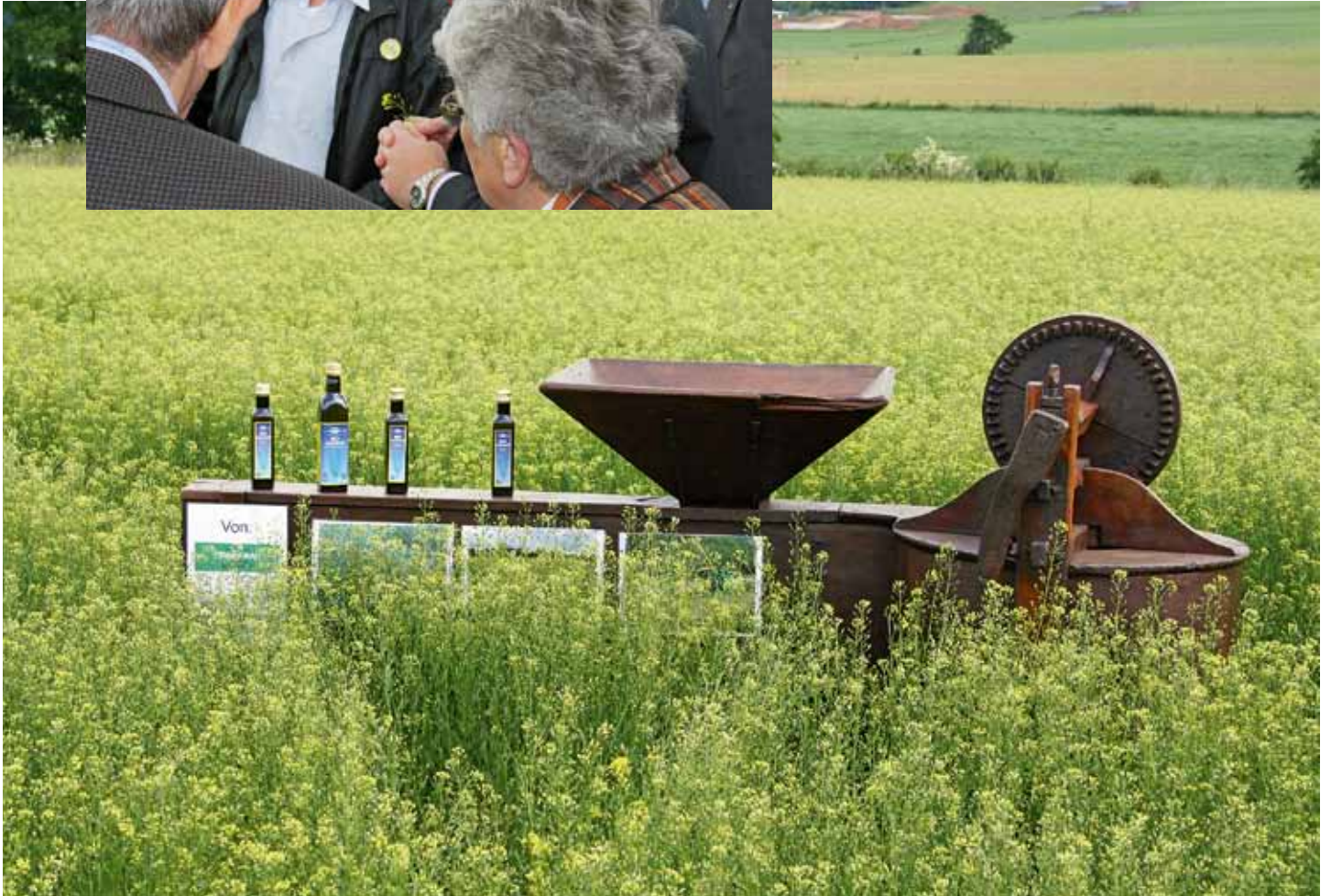
Alte Ölmühle inmitten der Leindotterpflanzung mit dem fertig abgefüllten Leindotteröl.